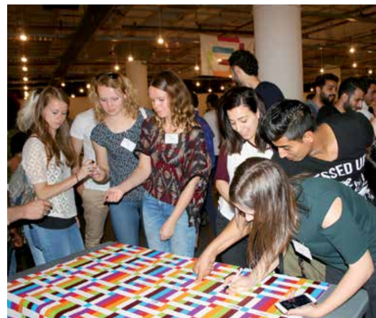
Bewoners van het Startblok tekenen afspraken om bij te dragen aan hun woonomgeving en onderlinge hulp en inspiratie.